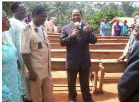
Réception des bancs par le Préfet