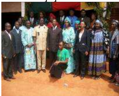
Les autorités locales et l'équipe Asbaf