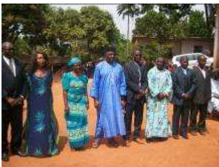
L'équipe de l'Asbaf

Ecole publique de Machoutvi à Manki II - Ecole publique de Fontain II à Foumban - Ecole publique de Foyet à Njimom